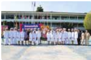
ปียะมหาราช