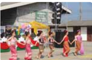
รำสี่ภาค งานผ้ากระบอก ออมทรัพย์ไม่ไผ่ สหกรณ์การเกษตรพร้าว จำกัด