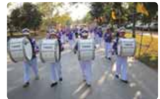
ฉลองพัตยศวัดบ้านหม้อ