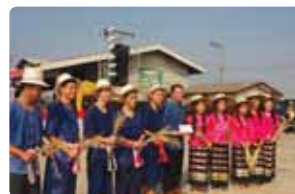
เดินกำรำเคียว งานข้าวหอมมะลิ สหกรณ์การเกษตรพร้าว จำกัด 2