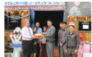
สวัสดีปีใหม่หัวหน้าหน่วยงานราชการ