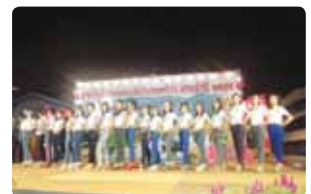
จัดประกวดสาวสวยวัยใส