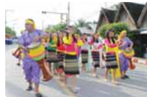
ฉลองพัตยศ วัดทุ่งหลวง