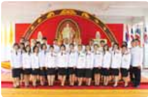
วันพ่อแห่งชาติ