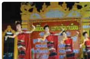
พ็อนนพบุรีศรีนครพิงค์เชียงใหม่ งานจุลกฐิน วัดทุ่งหลวง