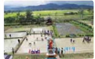
ปลูกวันแม่