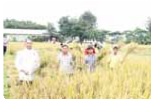
เกี่ยววันพ่อ