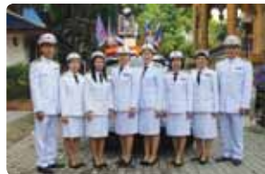
ฉลองพัตยศ วัดทุ่งหลวง