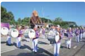
ผ้าป่าพระราชทาน (องค์โสมมาเสด็จ)