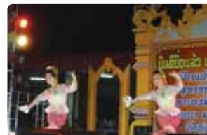
พ็อนมาลัย งานจุลกฐิน วัดทุ่งหลวง