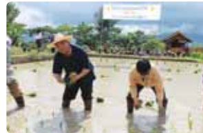
ปลูกวันแม่